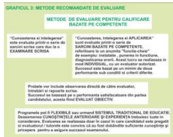
Fig. 3 Metode recomandate de evaluare

De la nivelul doi la nivelul 3 este necesar o aprofundare a cunoștințelor mai mare decât cea necesară pentru nivelul 2, completate cu alte domenii adiacente hidraulicii. La nivelul 3, competențele profesionale ar trebui să reflecte în mod clar un nivel de experiență, capabil să facă față unei game de activități numeroase și complexe pentru a respecta atribuțiile ocupaționale al acestui nivel.