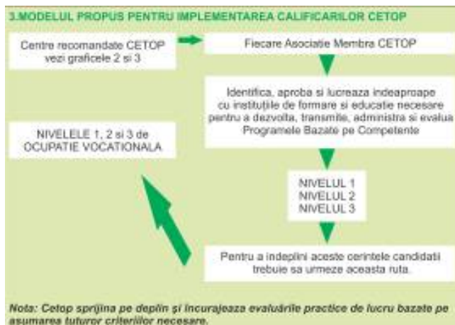
Fig. 4 Model de implementare a calificărilor CETOP

Fiecare membru CETOP va înmâna certificate individuale care să ateste nivelul de pregătire dobândit. Acest certificat va reprezenta o calificare recunoscută pe plan european. Pe durata perioadei de studiu și de dobândire a competențelor, toți candidații vor fi obligați să mențină un raport individual de aptitudini. Acesta ar trebui să formeze un portofoliu al cunoștințelor și competențelor obținute, aparținând nivelului ocupațional personal. Toate aceste rapoarte trebuie semnate pentru autenticitate și vor deveni bazele dezvoltării profesionale continue.