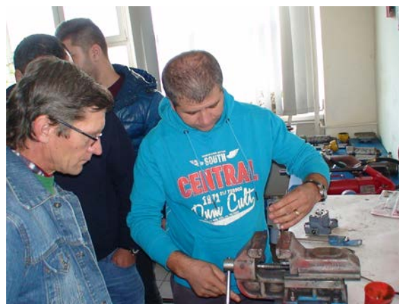
Fig. 5 Cursuri septembrie – octombrie și instruire practică în laboratoare

Aceste cursuri se adresează angajaților din domeniile ce utilizează acționări hidraulice și pneumatice. Surpriza avută de organizatori a fost ca la primele cursuri s-au înscris foarte mulți angajați cu pregătire superioară , idea fiind marea lipsă a lucrătorilor cu pregătire profesională medie tehnică în cadrul întreprinderilor. Chiar și în această situație cursul este prezentat la nivel accesibil tuturor salariaților dornici să devină specialiști în domeniul hidraulicii și pneumaticii.