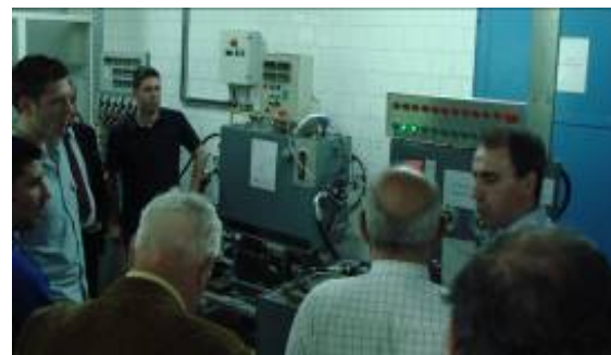
Fig. 4 Instruire practică în laboratoare